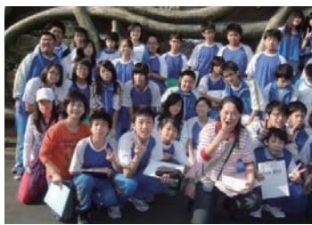
記下歷史的新與舊