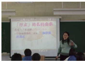
在歷史中與古人相遇

程之規劃分別在不同年段實施。實施的方式依學科性質分別為：(一)教室內進行(二)戶外實地踏查(三)教室內協同教學、戶外實地踏查三種方式同時進行。