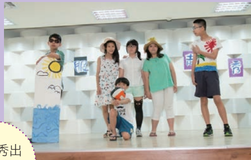
學生秀出不同的主題