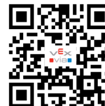
VEX VIA APP