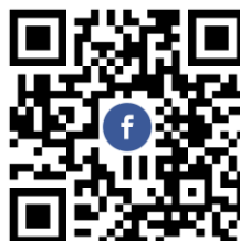
CACET FB 粉專