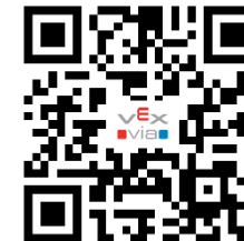
VEX VIA APP