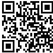
VTO 賽隊 管理系統