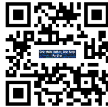
2022-2023 VTO 競賽官網