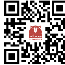
VRC 規則 問題統計表單