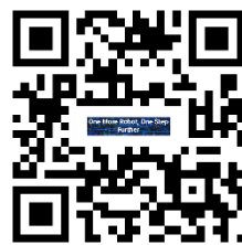
2022-2023 VTO 競賽官網