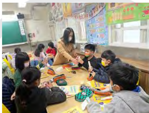
圖 3. 英語點讀操作自學課程

本次實驗係搭配學校所舉辦的 AI 英語冬令營活動，在五天活動中，利用其中一天來執行本次實驗。實驗流程設計為上午有 50 分鐘英語點讀自學課程、下午開始練習操作「光學智慧筆應用於語言及拼寫教學輔助學習系統」，如圖 3 所示。