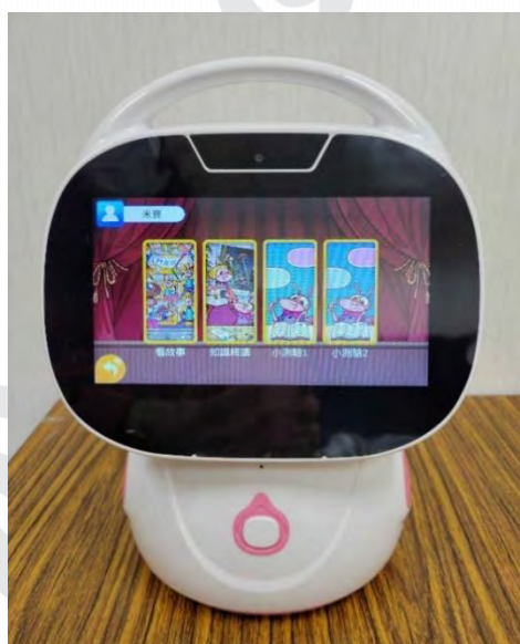
圖 1：教育機器人之外觀與學習內容

本研究的教學工具使用臺灣 KIZLAB 公司所開發的教育機器人。每個單元包含三個學習內容，分別為(1)故事情境影片學習：將影片內容以生活情境內容呈現，把抽象概念具象化，以提升學習動機和興趣。(2)重點知識精講：將故事中的重點數學概念統整與解析，加強基礎觀念。(3)課後測驗題庫：以素養導向設計題型，訓練學生的解決問題能力與信心養成。圖 1 為教育機器人之外觀與學習內容。