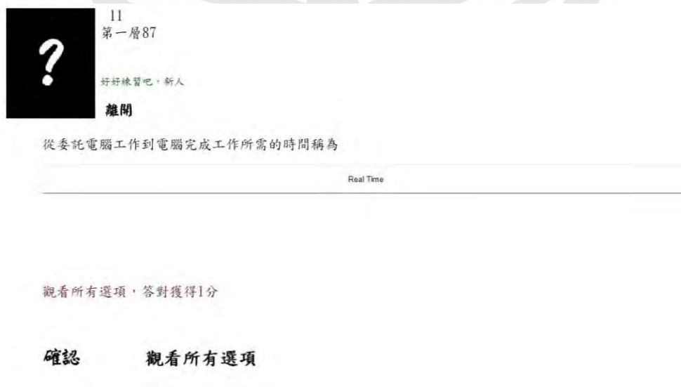
圖 2 實驗組練習介面(選擇正確答案)

如果選擇正確答案，系統會顯示圖 2 的畫面，此時可選擇「確認」答案或是「觀看所有選項」。如果選擇「確認」答案且答對該題，可以獲得 2 分；選擇「觀看所有選項」且答對該題，則僅會得到 1 分。若學生已無選項可以選擇或是選擇觀看所有選項，系統即會列出所有選項讓學生選擇，如圖 3 所示。