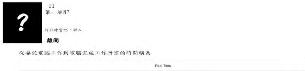
圖 1 實驗組練習介面

一共分成三個關卡分別為作業系統課程「第一章」、「第二章與第三章」和「第四章」，學生點選章節即可開始練習。實驗組的練習介面如圖 1 所示，左上角會顯示使用者的頭貼、名字和該章節獲得的分數，畫面中間會出現題目以及一個選項，使用者可以點 O 選擇該選項為正確答案，或是點選 X 觀看下一個選項。