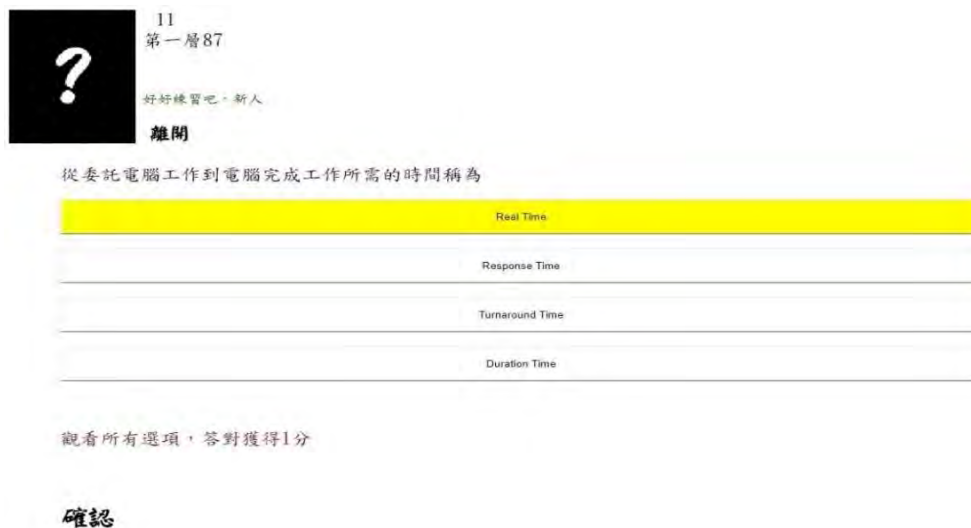
圖 3 實驗組練習介面(觀看所有選項)

相較於實驗組逐一呈現選項，對照組則是傳統選擇題的作答方式，系統會直接顯示四個選項讓學生選擇。