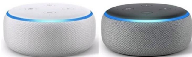
圖 1 本研究採用之智慧語音助理：Amazon Echo Dot 3 rd Generation

援各種語言的智慧音箱(Intelligent Voice Assistant, IVA)，眾所周知有 Amazon Alexa 系列 (Amazon, 2020)、以及 Google Assistant Speaker (Google, 2020) 等產品，皆符合純語音溝通條件。此兩家人工智慧引擎產品皆具一定品質，在消費性市場中各據一席之地。Google 產品支援中文語音，如若計劃打造全英文之聽、說環境，則又喪失強制性，而不符預期需要。種種因素評估之後，本研究決定採用 Amazon 第三代 Echo Dot (如圖 1 所示) 做為輔助語言學習的純語音試驗裝置。