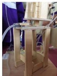
圖 3 板橋國中選手直接將底座抬升

贏得第一名與第二名的新北市板橋國中，在液壓機械手臂的底座就與大部分隊伍不同，是率先選擇將底座直接抬升的隊伍，如下圖 3 所示，在新北市地區賽亦獲得了第一名的佳績。