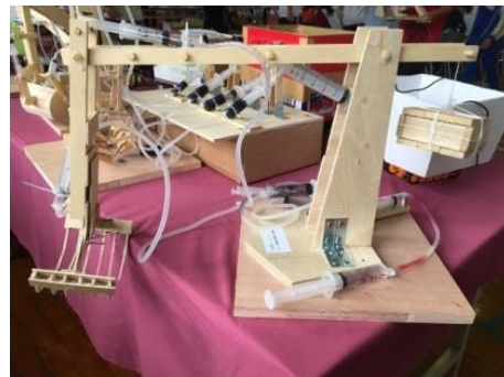
圖 11 東湖國中「預先裝物件」的承載裝置 圖 12 中山國中利用外加配重輔助操作