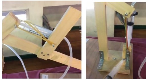
圖 9 建國國中使用鉸鏈組合主桿與上臂 圖 10 敦化國中使用橡皮筋輔助組合部件

在液壓機械手臂在操作過程中，操作者必須在針筒上做推、拉的動作才能達成部件運動的控制，有時這樣的操作會因部件本身重量或取物後的重量增加，導致操作者花費更多的力氣去完成控制，偶有因此操作錯誤或欠妥，導致取物不順、或高度來不及提升而撞到取物區或收集管的問題發生。為了克服這樣的問題，臺北市敦化國中的選手即安裝「橡皮筋」在各部件的組合部位，如上圖 10 所示。利用橡皮筋的彈力與形變自動恢復性質，輔助整座液壓機械手臂在操作過程中的所需施力，幫助較需要力氣的抬舉動作可以更順利地完成，也更有機會可以順利夾取全國賽才加入的罐裝飲料物件。