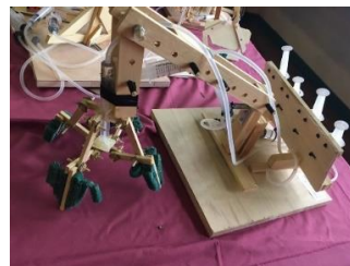
圖 4 較難克服收集管高度之造型