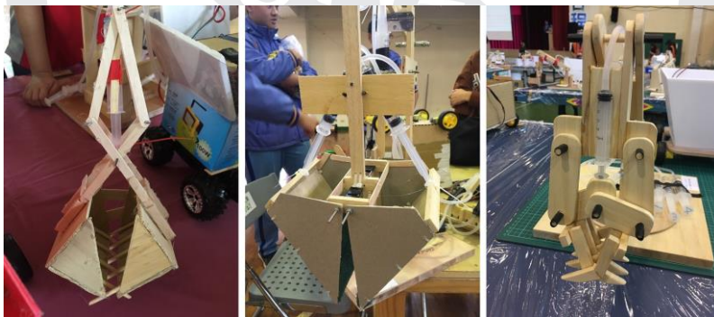
圖 6 由左至右分別為鏟爪式、鏟夾式、爪夾式

在爪子的造型設計上，研究者將選手主流造型分為大致以下三種款式：鏟爪式、鏟夾式、爪夾式，如下圖 6 所示：