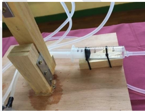
圖 7 汐止國中採用連桿式轉盤 圖 8 華山國中使用鉸鏈組合底座與第一主桿

今年的參賽隊伍，有許多學校使用「鉸鏈」來解決轉動的問題，現成的鉸鏈即具備金屬的強度與韌性，旋轉軸直接藏於鉸鏈當中，穩定與易達性相對高於連桿式轉盤。在液壓機械手臂的製作中，使用鉸鏈組合底座與第一主桿，讓固定不動的底盤，亦可完成轉動方向的工作，是既有效率、又具備穩定的組合方法；有些隊伍還搭配 L 型角鐵，讓整體的強度再向上提升。如新竹縣華山國中、台北市東湖國中、基隆市中山高中國中部所採用的即為鉸鏈組合裝置，如上圖 8 所示。