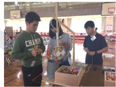
圖 5 東湖國中的懸臂結構

同樣為了克服爪子取物後抬升的力矩問題，將液壓機械手臂設計為一懸臂式的結構亦是有效解決此問題的方法，雖底座高度仍等於桌面，但第一主桿的高度已經將整個上臂的高度抬升，讓爪子端的抬升更加省力，在取物後也能高速、省力移至收集管上方放下物件。第三名新北市汐止國中、基隆市中山高中國中部、第四名新北市中平國中、臺北市東湖國中、第五名臺北市東湖國中皆採用如此的造型設計，如右圖 5 所示。