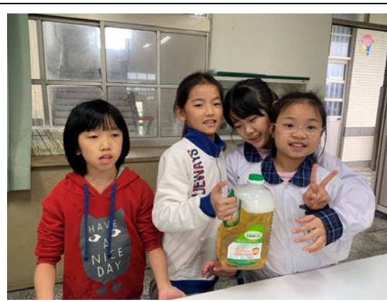
圖5、愛地客環保慈善洗碗精配製