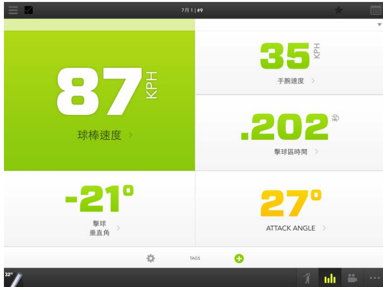
圖 2. 可視化資料呈現

原有的 FABRIC 資訊應用模式整合了大數據、雲端儲存與物聯網概念，近年來 AI 資訊科技蓬勃發展，將現有的大數據資料庫的應用範圍擴大，提供更多元化的服務。