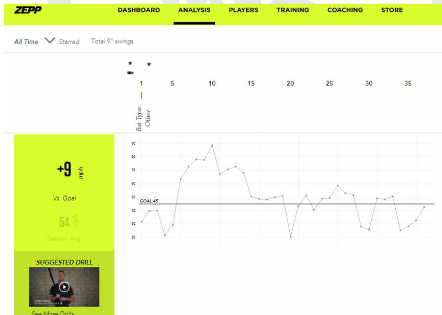
圖 3.提供訓練成果分析與建議

以運動感應器應用為例，除了上述資料的呈現之外，廠商針對大數據應用與整合提出許多新的服務，例如針對訓練成果提供相關服務(圖 3、圖 4 所示)