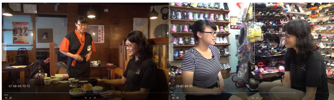
圖 5 餐廳用餐會話