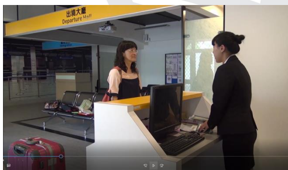
圖 3 機場報到櫃臺對話

情境會話是利用旅遊文化系情境教室拍攝，包括機場報到櫃臺、機艙、海關查驗、飯店、商店等構成。由研究者和另外一名日籍學生共同拍攝。