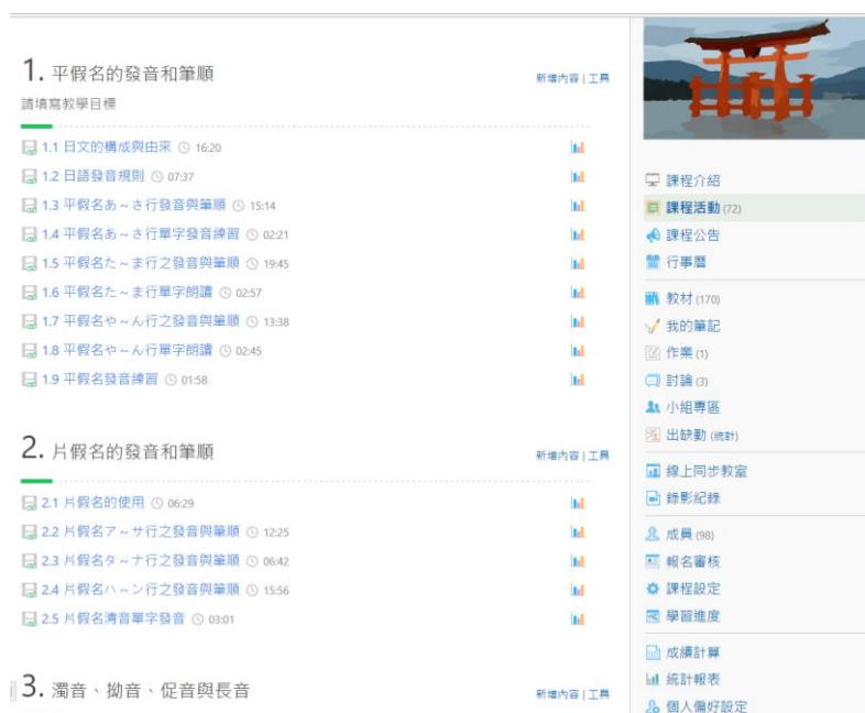
圖 2 電腦輔助語言學習平台介面