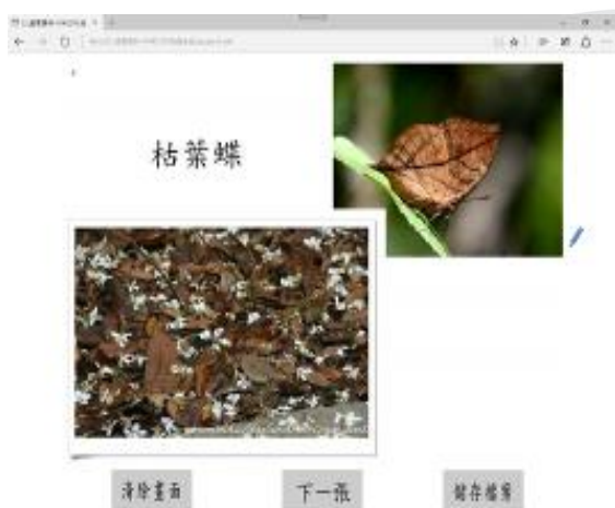
圖 3 昆蟲原始及偽裝圖片