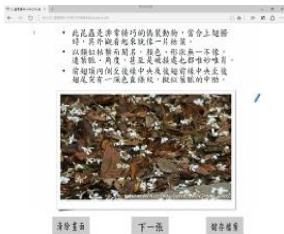
圖 2 文字說明及昆蟲偽裝圖片