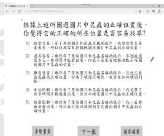
圖 4 觀察昆蟲偽裝後之問卷圈選