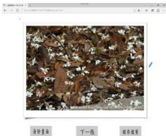
圖 1 單一昆蟲偽裝圖片