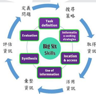
圖 1：筆者自行繪製圖表。